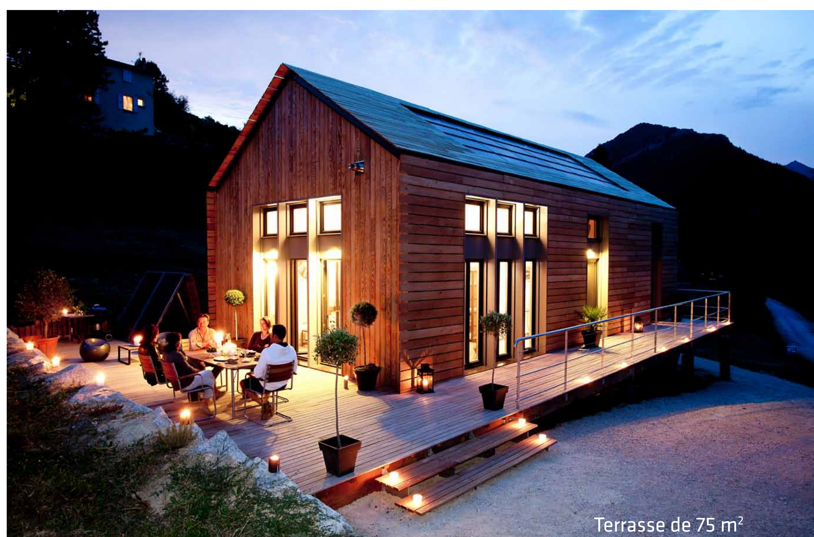
Terrasse de 75 m 2