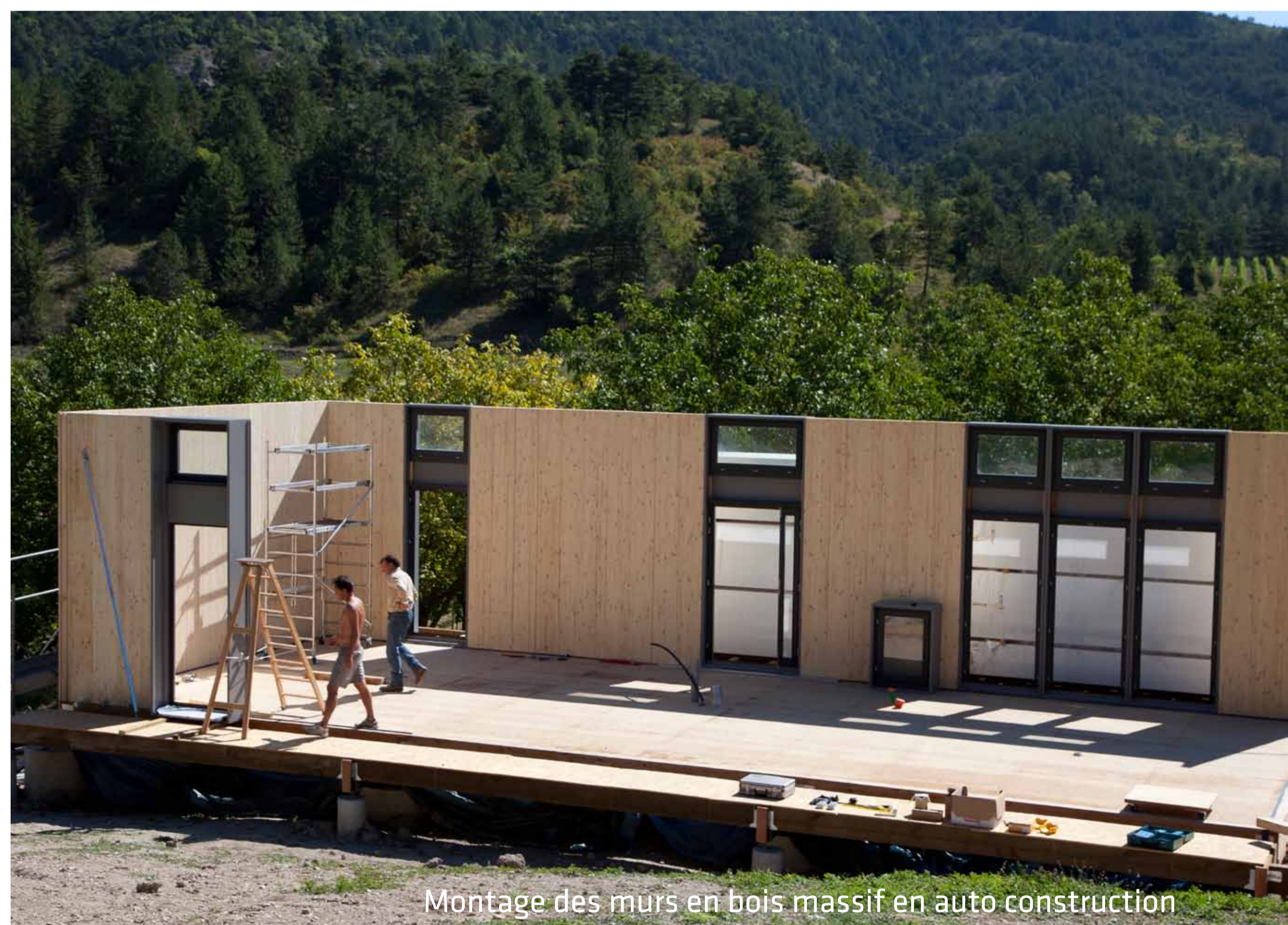
Montage des murs en bois massif en auto construction